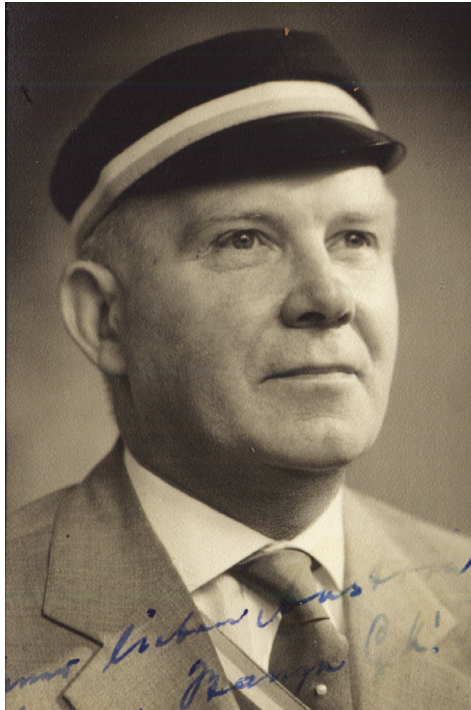
Hermann Stange (1907–2002)