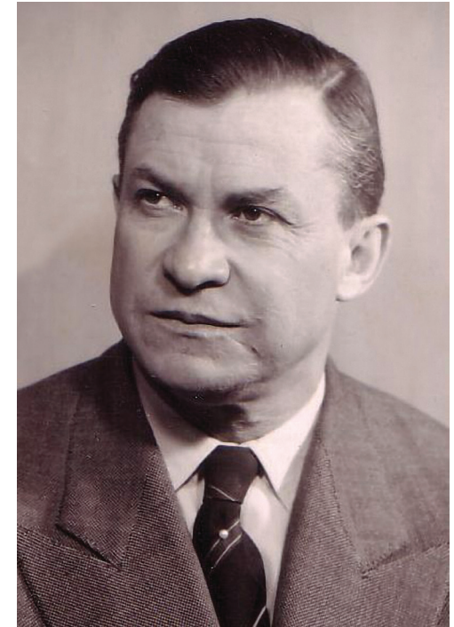
Hans-Georg Sachs (1911–1975)